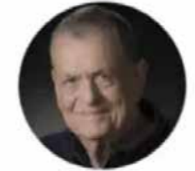
Aaron Ciechanover 2004年诺贝尔化学奖