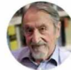
Martin Karplus 2000年诺贝尔化学奖