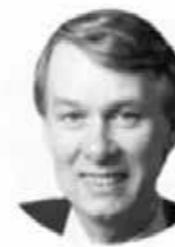
Sir Richard Roberts 1993年诺贝尔医学奖