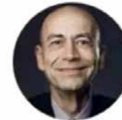
Thomas Sudhof 2013年诺贝尔医学奖