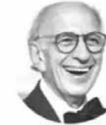
Eric R. Kandel 2000年诺贝尔医学奖