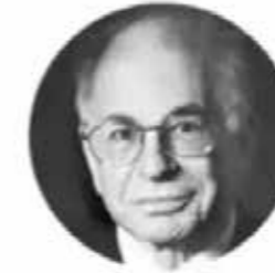
Daniel Kahneman 2002年诺贝尔经济学奖