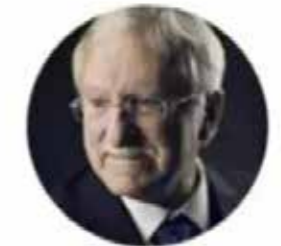
Paul Modrich 2015年诺贝尔化学奖