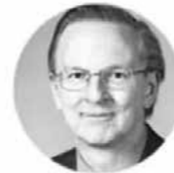
Jack Szostak 2009年诺贝尔医学奖